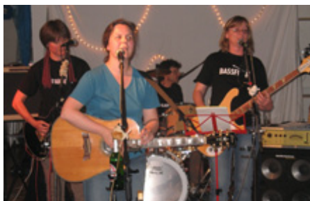
Musik: Murphy's friends